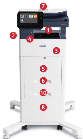
Barevná multifunkční tiskárna Xerox® VersaLink C505 Tisk. Kopírování. Skenování. Faxování. E-mailly.