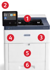
Barevná tiskárna Xerox® VersaLink C500 Tisk.