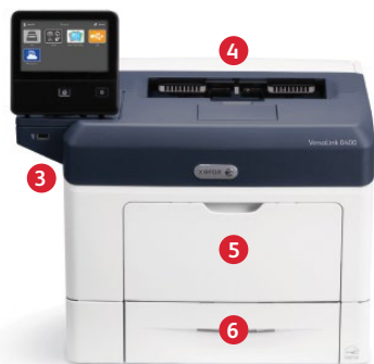
Tiskárna Xerox® VersaLink B400 Tisk.