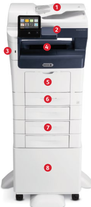
Multifunkční tiskárna Xerox® VersaLink B405 Tisk. Kopírování. Skenování. Faxování. E-mail.